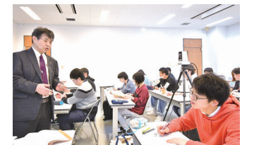
児童・家庭福祉論

医学一般、精神医学、保健医療論、医療と福祉のマネジメント、臨床心理学、児童・家庭福祉論、カウンセリング、健康と運動、コミュニケーション技術 など