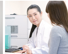
精神保健福祉士 (※) 秋田キャンパス不可