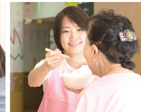
介護福祉士 (※) 秋田キャンパス不可