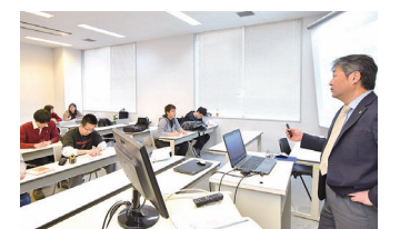
権利擁護と成年後見

組織論、福祉行政と福祉計画、福祉経営論、権利擁護と成年後見、都市政策論、栄養学、運動生理学、公務員セミナー、判断/数的推理 など