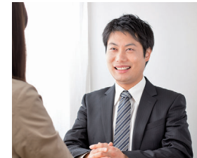
社会福祉士 (医療ソーシャルワーカーを含む)